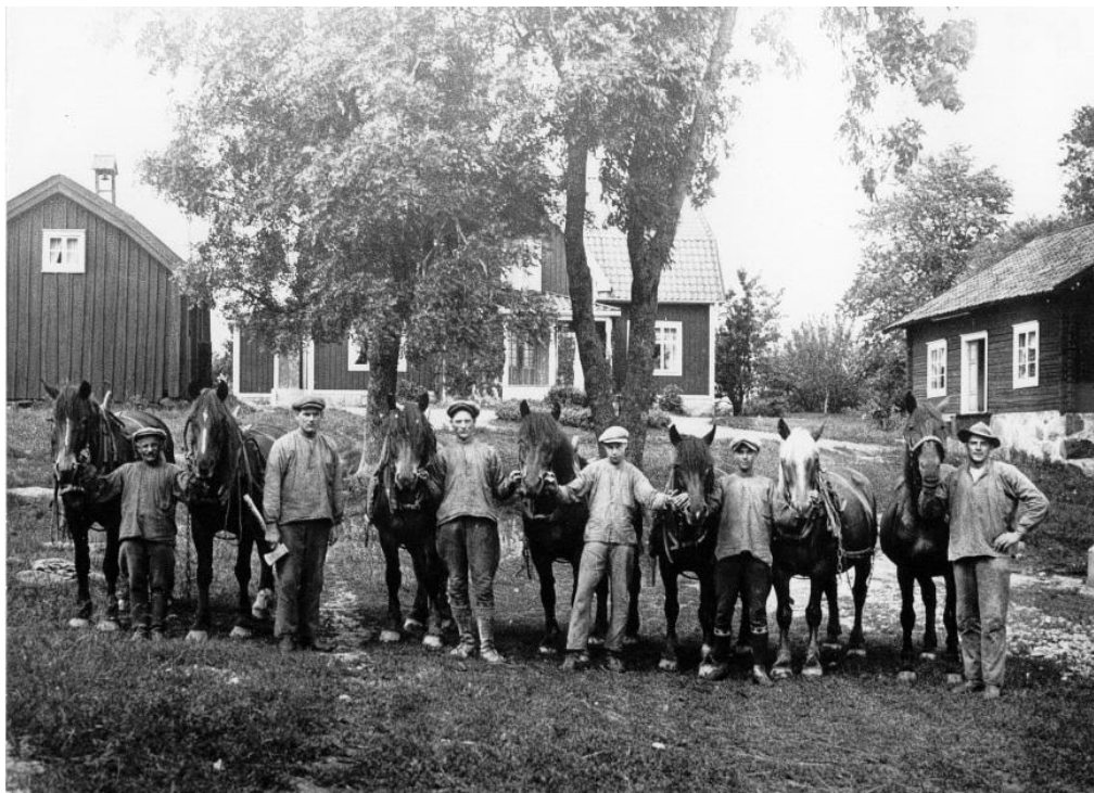
Hallsta gård 1924

I Erikslund stannade bussen vid den höjd mitt i centrum där kaptensbostället Hallsta gård var beläget, en av fem herrgårdar i Dingtuna. Det var den östligaste gården i socknen. Jordbruket lades ned på 1970-talet och byggnaderna revs efter 1990, men då hade redan exploateringen av området börjat med att Traffic Hotel öppnade 1985. Handelsområdet skulle väl egentligen ha hetat Hallsta, men det ansågs kollidera med orten Hallstahammar, som ofta benämns Hallsta. Hallsta gårdsgata blev det i alla fall som minne av en svunnen epok.