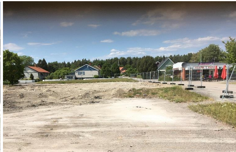
Tunahallen går / har gått i graven