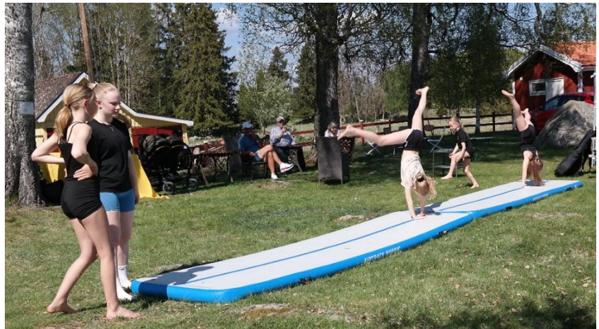
Liten gymnastikuppvisning med Dingtunaflickor

Dagen blev en succé med strax över 200 deltagare - en bra bit över förväntningarna. Folk anlände i en jämn ström under öppet hus-tiden. Roligt att så många nyinflyttade hade hörsammat inbjudan och att så många unga familjer med barn kom.