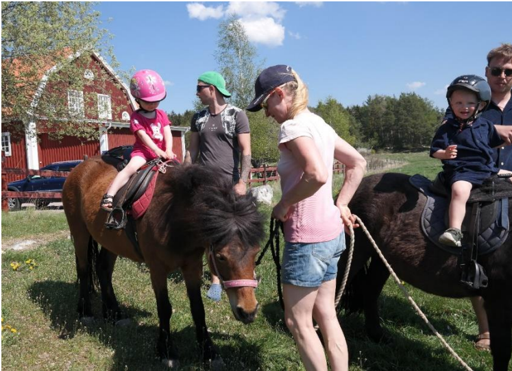
Ponnyridningen var populär