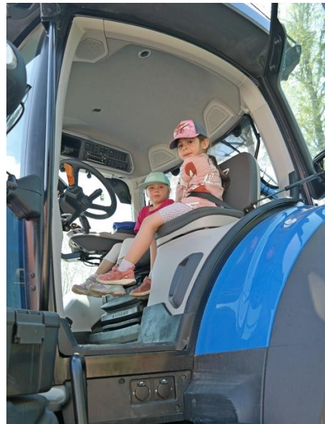
Högt över marken i jättetraktorn

Det var Dingtuna Föreningsråd som var arrangör för det hela. Rådet hade sökt bidrag från Postkodstiftelsen för att ordna med aktiviteter och gemensamma träffar, speciellt för nyinflyttade till socknen. En del av det bidraget gällde träffen den 14 maj.