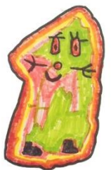
Dingisen Prinsessan Belle