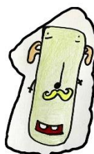
Dingisen Foffa Toffla