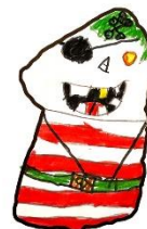
Dingisen Kapten Guld tand