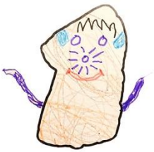
Dingisen Lille katt

I förra numret av Dingsnytt utlystes en målargävlingen. Över 50 fantastiska bidrag skickades in. Vinnaren presenteras på nästa sida och nedan får ni njuta av ett gäng från de inskickade bidragen. Samtliga bidrag presenteras på Dingsarnas Facebooksida.