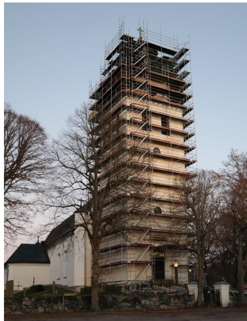
Bild den 8 nov. före inklädnaden