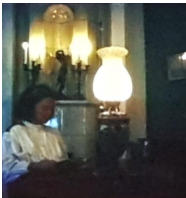
I oljelampans sken.