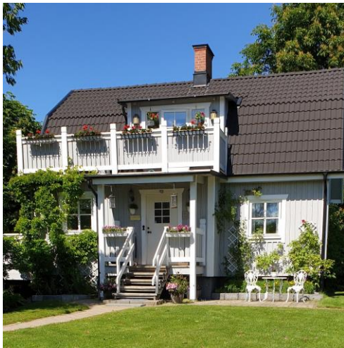
Västjädragränd 7 år 2001

När döttrarna hade flyttat hemifrån och villan på Vårfridsgatan blev onödigt stor totalrenoverades barndomshemmet med adress Västjädragränd 7 och stod färdigt 23 december 2001.