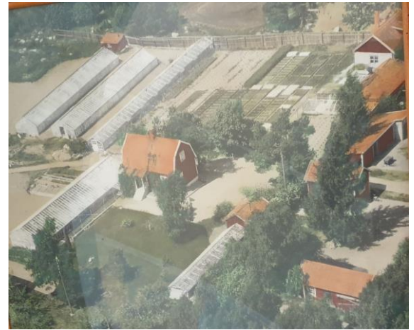
Flygfoto i början av 50-talet