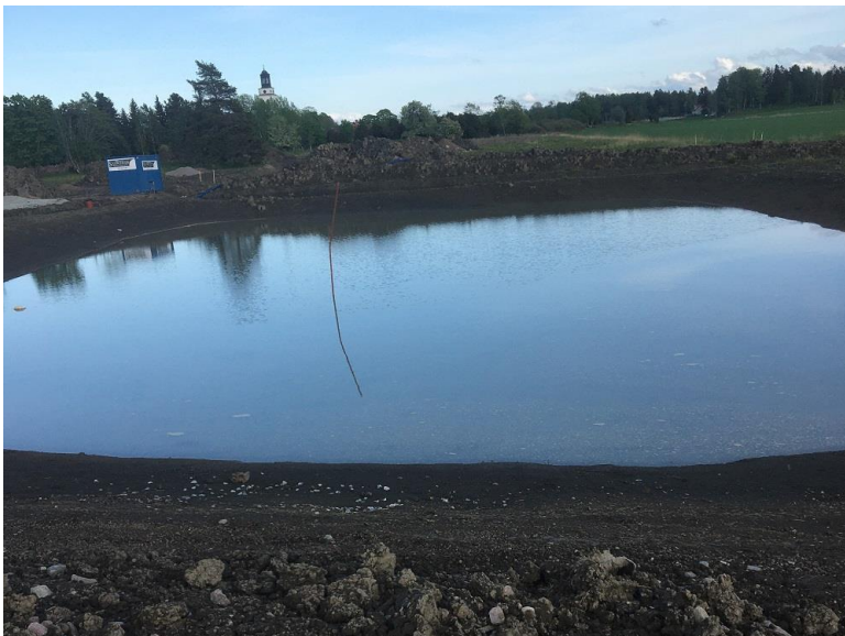
Dingtunas nya Hafsbad?

För Uppsala Akademiförvaltning Göran Johansson Arosgården AB