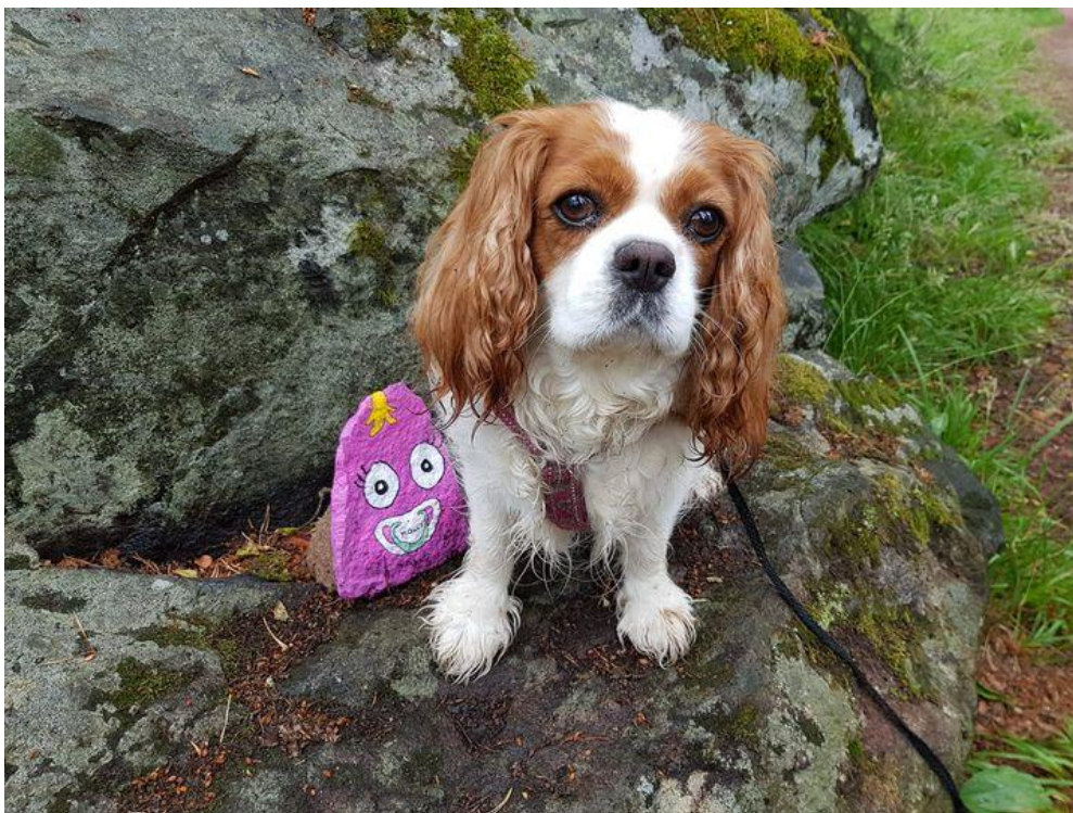
Alizia och en Dingis