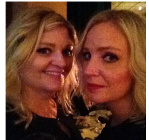
Jag och min syster.

Jag kan berätta att Daniel Craig är mycket kortare än man tror & väldigt trevlig! Likaså är George Clooney oxå mkt kortare , film är fusk!